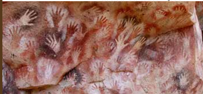
Cueva de las Manos | Santa Cruz - Argentina